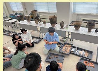
研究体験のようす