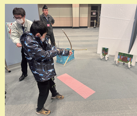
弓矢体験のようす